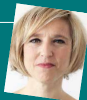
Valentine Goby Murène (Actes Sud)