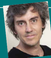
Sylvain Prudhomme Par les routes (L'Arbalète / Gallimard)