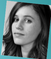
Kaouther Adimi Les petits de Décembre (Le Seuil)