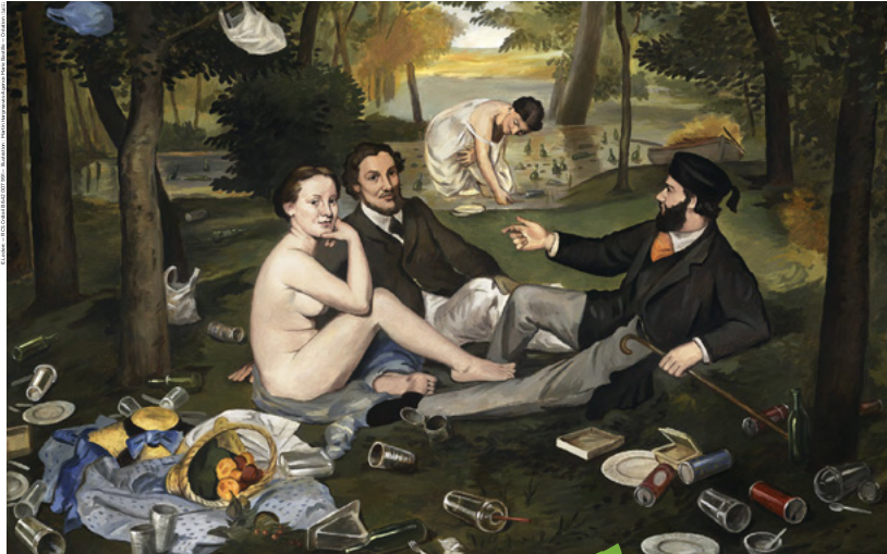
LE DÉJEUNER SUR L'HERBE ÉDOUARD MANET

COLLECTION NETTOYONS LA NATURE E.LECLERC